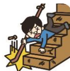
階段で転倒してケガ