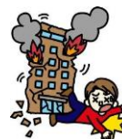
地震によるケガ <天災危険補償特約付>