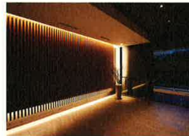
■エントランスホール

ゆったりとしたエントランス、ちょっとした会合や来客、貸切りでのホームパーティーに利用できるカンファレンスルームなど快適生活をサポートします。(貸し切りは有料)