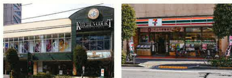
●1 キッチンコート(スーパーマーケット) ●2 セブンイレブン(コンビニエンスストア)

【建物概要】所在地/東京都新宿区北町37 敷地面積/923.49㎡ 建築面積/508.50㎡ 延床面積/2164.98㎡ 構造規模/RC造 地上8F 地下1F 総戸数/56戸 住居専有面積/26.08㎡~42.64㎡ 建築時期/2019年3月竣工