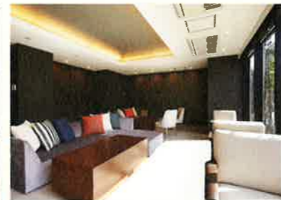
■カンファレンスルーム