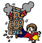
地震によるケガ 〈天災危険補償特約付〉