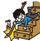
階段で転倒してケガ